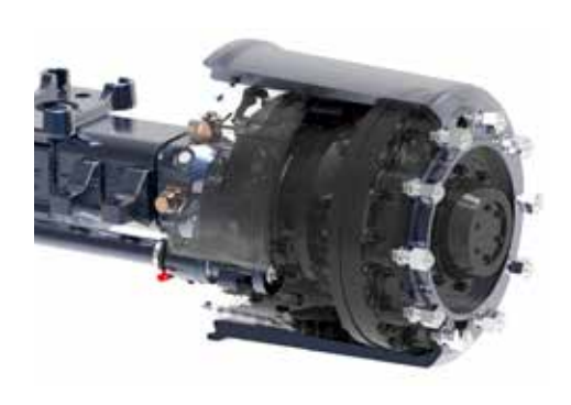
A fékszerkezet felújítása és cseréje könnyen, a hajtómű megbontása nélkül végezhető.