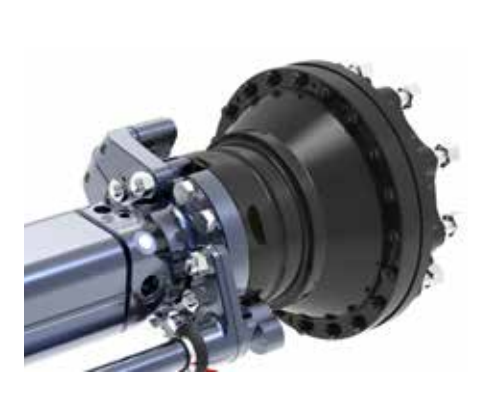
A különböző fékkulcs-pozíciók révén bármely rugózási rendszerrel kombinálható.