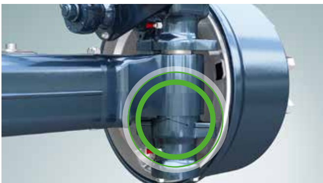
Lenkgehäuse bei Geradeausfahrt (0-Stellung)