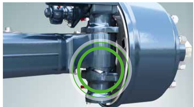
Lenkgehäuse bei Kurvenfahrt (bis 27°, je nach Fahrzeugausführung)

Achskörper und Achsschenkel sind über Lenkbolzen mit wellenförmigen Drucklagern verbunden. Bei Geradeausfahrt (0-Stellung) halten die wellenförmigen Druckscheiben die Räder in der Spur. Das Fahrzeuggewicht presst die Wellenkonturen der oberen und unteren Druckscheiben aufeinander. Die Räder bleiben in korrekter und stabiler Geradeausstellung. Folgt der Anhänger der Zugmaschine in eine